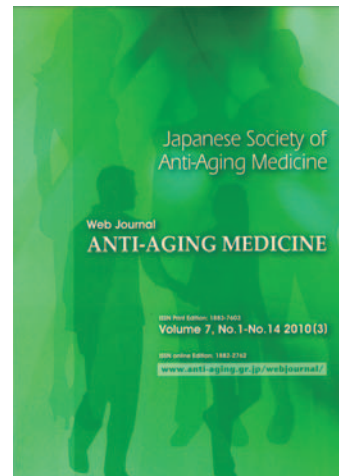
Web Journal「ANTI-AGING MEDICINE」2010年プリント版